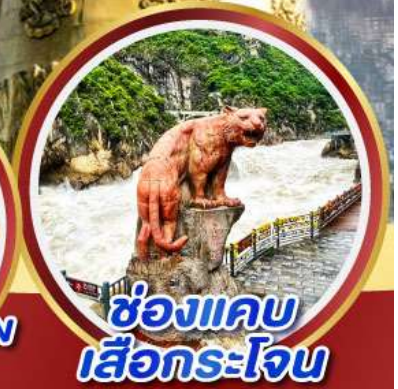
ช่องแคบ เสื่อกระโจน