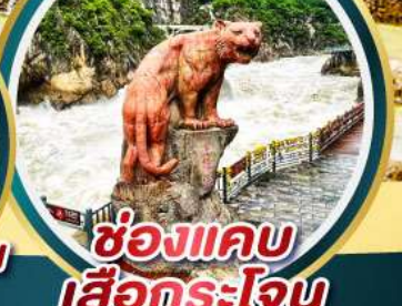
ช่องแคบ เสือกระโจน