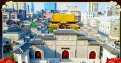
ถนนโบราณวังโซ่งกง

เยือนหมู่บ้านริมผา “นุ้เขาเทวดาวังเซียนกู่”