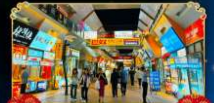
ถนนจินเจีย