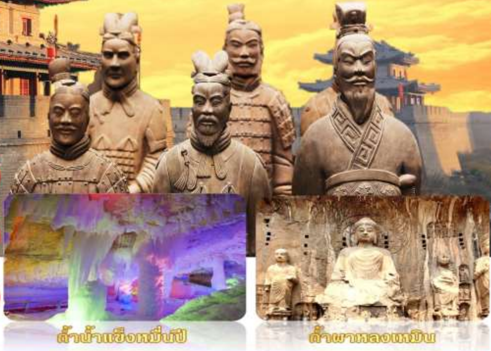
ถ้ำน้ำแข็งหมื่นปี