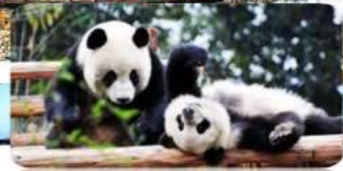
ศูนย์วิจัยหมีแพนด้า

เมนูพิเศษ สุกี้หม่าล่า บุฟเฟต์ / เปิดชกก๊อง