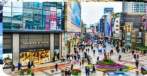
ถนนคนเดินชุนซีถู๋