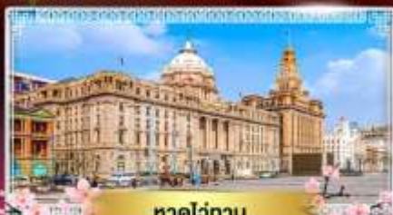
หาดไถ่กาน

"ชมดอกซากุระนลิบาน ณ แดนมังกร" ล่องเรือทะเลสาบตะวันตก ไข่มุกแห่งหางโจว