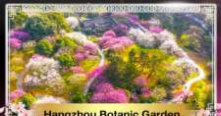
Hangzhou Botanic Garden