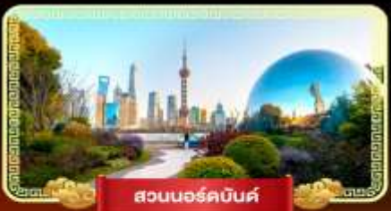
สวนนอร์คบันด์