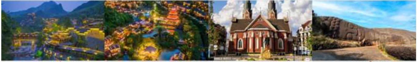
หุ่นเขาเทวดาวิ่งเชียนกู่