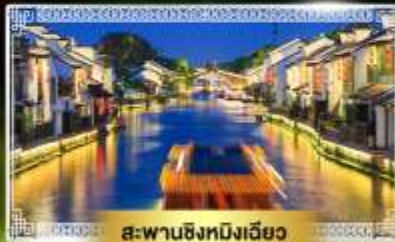
สะพานชิงหมิงเฉียว