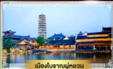
เมืองโบราณฝูหยวน