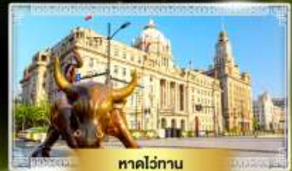
หาดว่อกาน