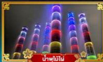
น้ำพุไม๊ผៃ