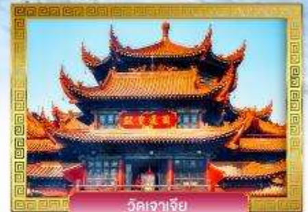
วัดเจาเจีย