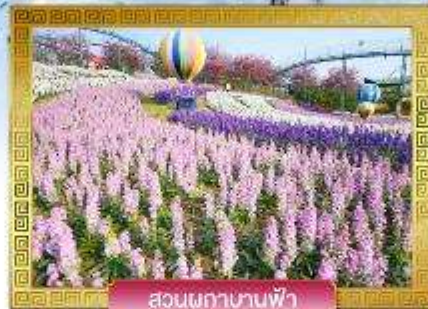
สวนผักกาดบานฟ้า