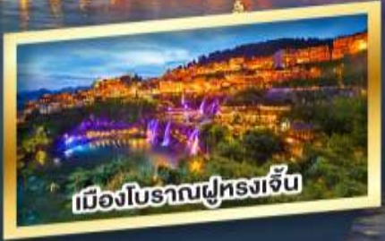
เมืองโบราณฟูหลงเจิน