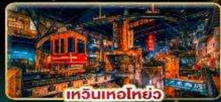
เทวินเทอไฮย๋อ