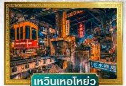
เหวินเหอโฮ่ย