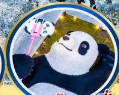
แพนต้าเซลฟี