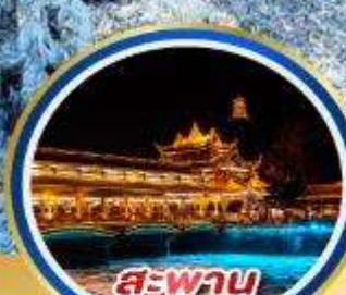
สะพาน หนานเลี่ยว