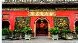
วัดต้าเจ้อ