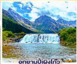
อุทยานปี้ฝงโกว