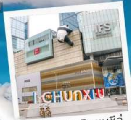
ถนนคนเดินชุนซีลู่