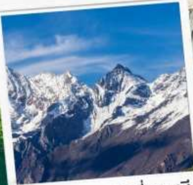
อุทยานภูเขาสี่ดรุณี