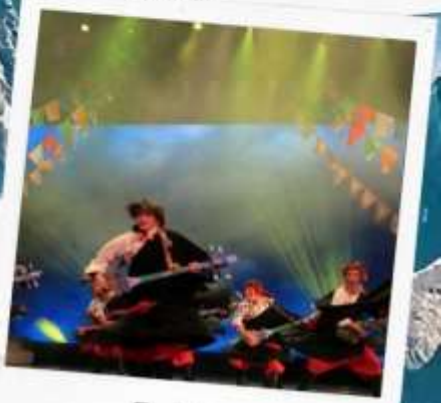
โชว์ทิเบต