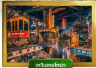
เขื่อนทงโหย่ว

เดินทางโดย : สายการบินโล่ออนแอร์ อาหาร : 13 มื้อ โรงแรม : 4 ดาว