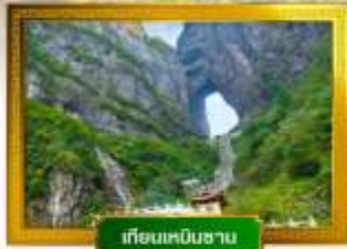
เทียนหมินซาน