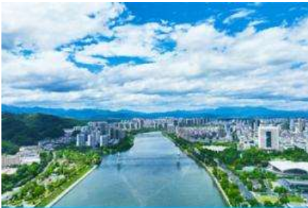
เมืองหวงซาน

ค่ำ รับประทานอาหารค่ำ ณ ภัตตาคาร พักที่ WIENNA HOTEL OR XIN AN YAN HOTEL ระดับ 4 ดาวท้องถิ่นหรือเทียบเท่าในเมืองหวงซาน