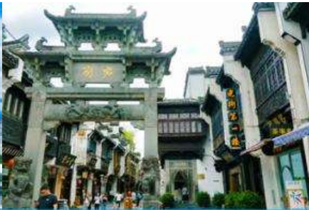
ถนนโบราณถนนซีหล่าเจีย