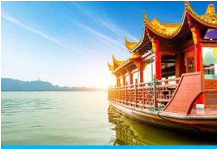
ล่องเรือทะเลสาบซีหู