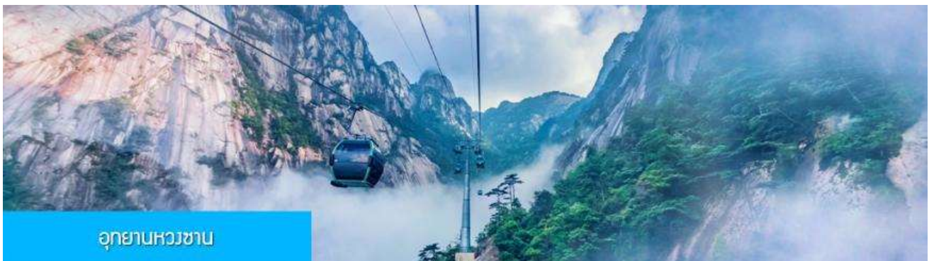
อุทยานหวงซาน

เช้า รับประทานอาหารเช้า ณ ห้องอาหารของโรงแรม หลังอาหารเช้าท่านให้ท่าน อิสระพักผ่อนตามอัธยาศัยใน โรงแรมที่พัก