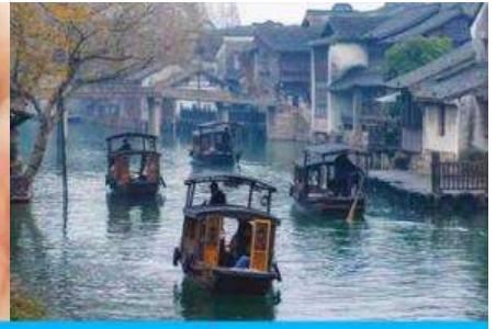
เมืองโบราณผู่ยวน