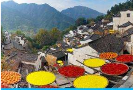
หมู่บ้านโบราณหวงหลิ่ง

พักที่ WANCHUAN HOTEL โรงแรมระดับ 4 ดาวท้องถิ่น หรือเทียบเท่า ในอุทยาน วู่หนี่โจว