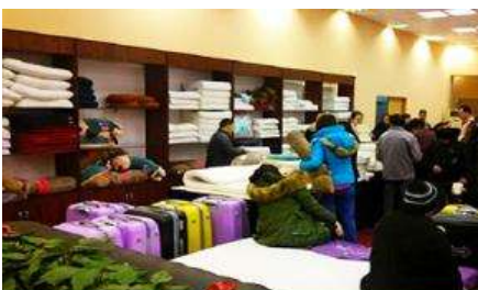
ศูนย์จำหน่ายผลิตภัณฑ์ยาวพารา

พักที่ PUJIN HOTEL โรงแรมระดับ 4 ดาว ที่อยู่ติดกับหมู่บ้านวัฒนธรรมผู่ยวนเพื่อสะดวกในการเที่ยวชมหมู่บ้าน