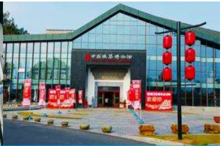
พิพิธภัณฑ์อาหารพื้นเมืองหูโจว