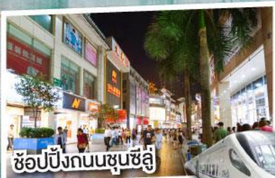
ช้อปปิ้งถนนชุนชี่