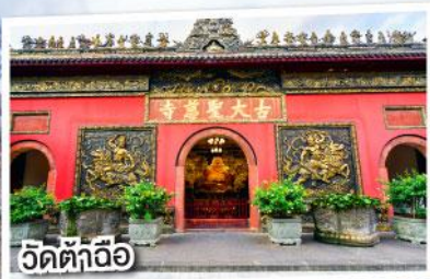
วัดต้าฉื่อ