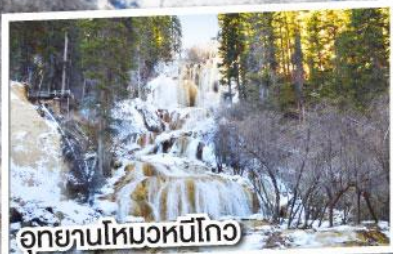
อุทยานโหมวหนี่โกว