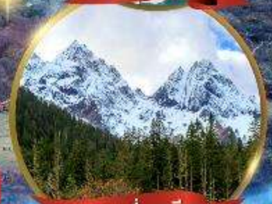
ภูเขาสี่ดรุณี