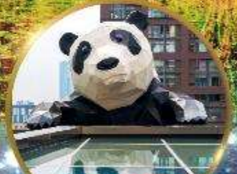
แพนด้ายักษ์

มหัศจรรย์ความงาม อุทยานจิวจ้ายโกว (รวมรถเหมาเที่ยวอุทยานเต็มวัน) ชมอุทยานหวงหลง (รวมกระเช้า) • สี่ดรุณี • อุทยานชวงเจียวโกว (รวมรถอุทยาน) เมืองเก๋าชงพาน • ถนนคนเดินจินหลี่ + ไท่ตู้หลี่ • ชมแพนด้ายักษ์ป็นตึก