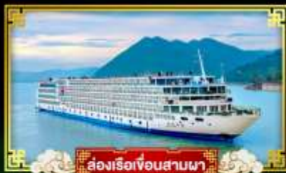
ล่องเรือเขื่อนสามผา