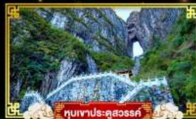
ทิวเขาประตูสวรรค์