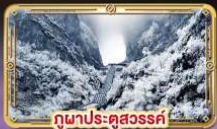
ภูเขาประตูสวรรค์