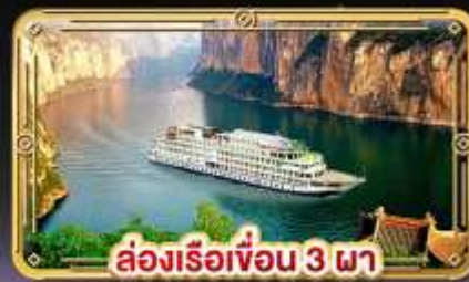
ล่องเรือเขื่อน 3 ภา