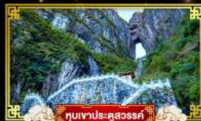
หุบเขาประตูสวรรค์