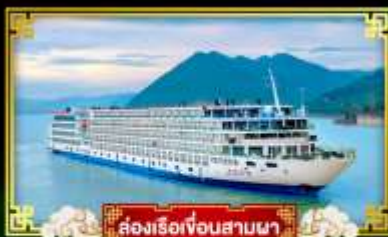
ล่องเรือเจ็อนสามผา