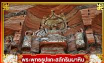
พระพุทธรูปแกะสลักหินผาศิน