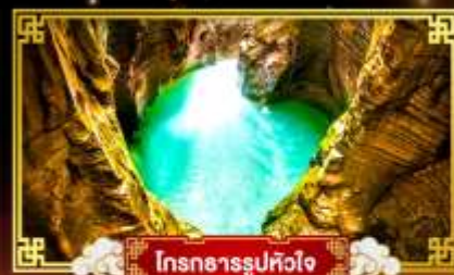
โตรกธารรูปหัวใจ