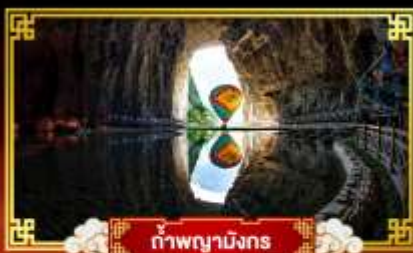
ถ้ำผานางมิ่งกร