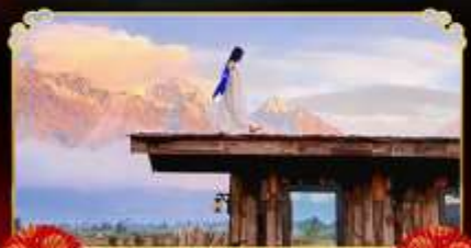
YUN TI YANG CAFE