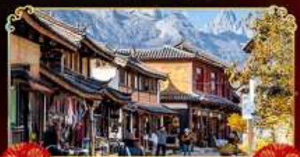
เมืองเก่าไปซา