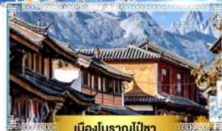
เมืองโบราณไปซา