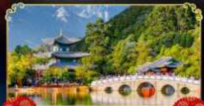
สระมิ่งกรต้า