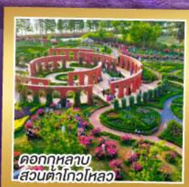
ดอกกุหลาบ สวนต้าโกวหลอ