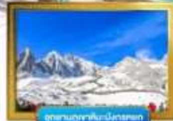
อุทยานภูเขาหิมะมังกรหยก

เดินทางโดยสารการบินจีนนำอิสเทิร์นแอร์ไลน์