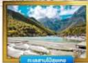
ทะเลสาบป๋อซูหยง