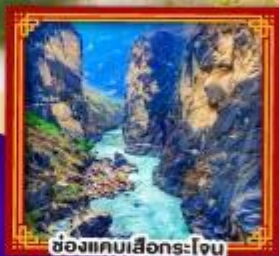
ช่องแคบเสื่อกรโง