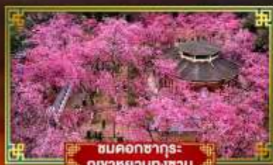
ชมดอกซากุระ ภูเขาหยวนหงซาน