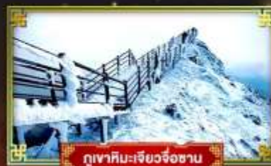
ภูเขาหิมะเจียวจื่อซาน