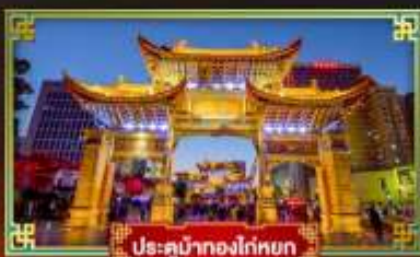
ประตูน้ำทองโต๋ทก