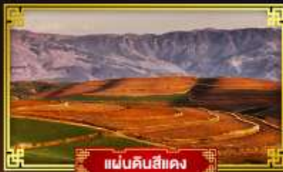
แผ่นดินสีแดง