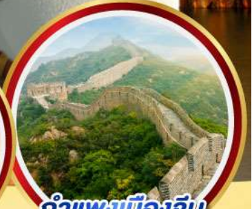
กำแพงเมืองจีน ด่านจวิ๊ยกทวน