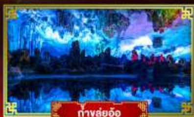
ทางลือฮือ

"ดินแดนแห่งสายน้ำและขุนเขา" สัมผัสประสบการณ์นั่งบอลลูนชมวิวมุมสูง