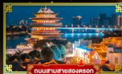
ถนนสายสองนคร