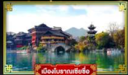
เมืองโบราณเซี่ยซือ