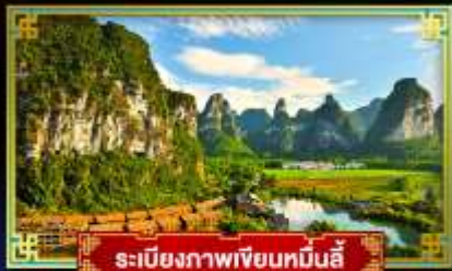
ระเบียบภาพเขียนหมินอี