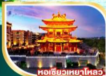
หอชิวเหยาไหล