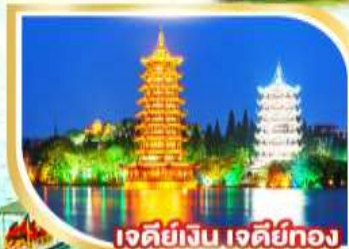
เจดีย์เงิน เจดีย์ทอง