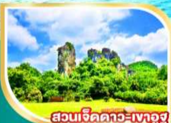
สวนเจ็ดดาว-เขาอูซู