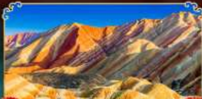
ภูเขาสายรุ้งจางเย่

เดินทางตามรอยเส้นทางสายประวัติศาสตร์โลก ชมโอเอซิสกลางทะเลทราย "ทะเลสาบพระจันทร์เสี้ยว"