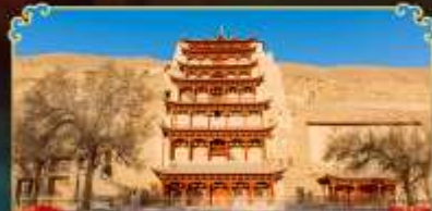
กำแพงสลักม่อเกาตู