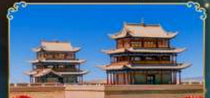
กำแพงเมืองจินเจียววี่กวน