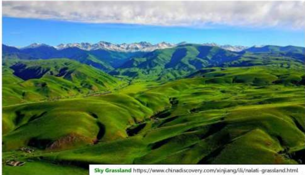
Sky Grassland https://www.chinadiscovery.com/xinjiang/li/nalati-grassland.html

หมายเหตุ 1. รถอุทยานอาจจัดเป็นรถแบดเจอร์ หรือ รถปัสไฟฟ้า ตามเหมาะสมหรือตามคิว ขึ้นอยู่กับการจัดการของอุทยาน 2. การใช้กระเช้าซาซันเนินเขาเพื่อชมวิว ขึ้นอยู่กับสภาพอากาศ และการพิจารณาเรื่องความปลอดภัยของอุทยานฯ หัวรถไม่สามารถจะเข้าไปเปลี่ยนแปลงได้ ถ้าอากาศไม่อำนวยตอนซาซัน อาจเพียงขอลอเวลาสลับเป็นใช้กระเช้าซาซง หรืออาจเปลี่ยนเป็นรับ-ส่งเนินเขาด้วยรถอุทยานเท่านั้น