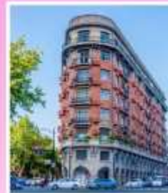
ถนนอู่คัง