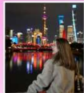
สะพานจ๋าฟู่ชือยิว