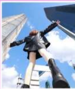
3 ตึกใหญ่ แห่งเมือง เซี่ยงไฮ้