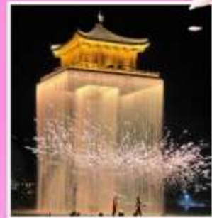
อู๋นวิโจว