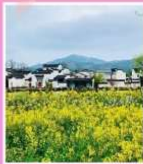
หมู่บ้านโบราณเฉิงชาน