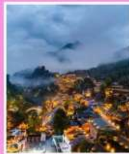
หุบเขาเทวดาวังเซี่ยนทู่