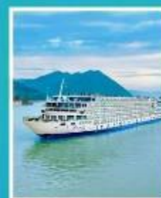
ล่องเรือสำราญ