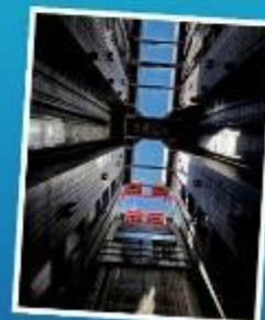
ลิฟท์ข้ามเขื่อนซานเสียดำป่า