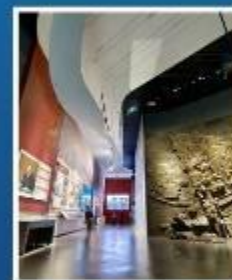
THREE GORGES PROJECT MUSEUM