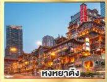
หงหยาดิ่ง