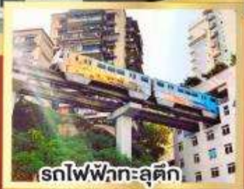
รถไฟฟ้ากะลุ่ตัก