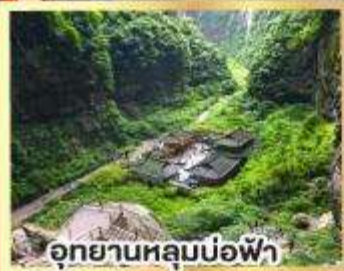
อุทยานหลุมบ่อฟ้า