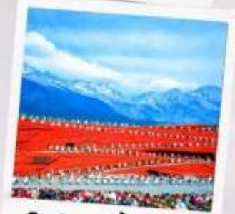
โชว์ จางอีโหมว