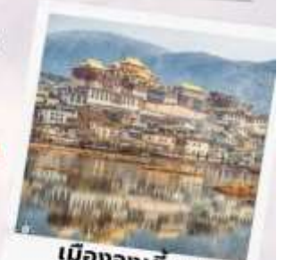
เมืองจงเตียน แซงกรี่ล่า