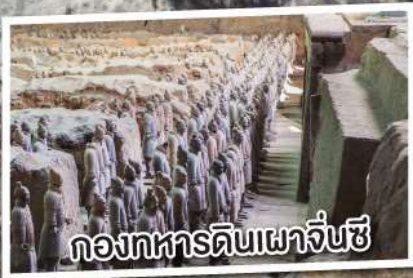
ถ้ำทวารดินเผาเจี๊จวง