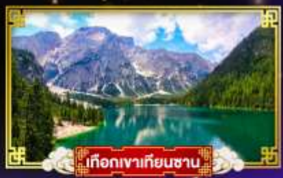
เกือกเขาเทียนชาน