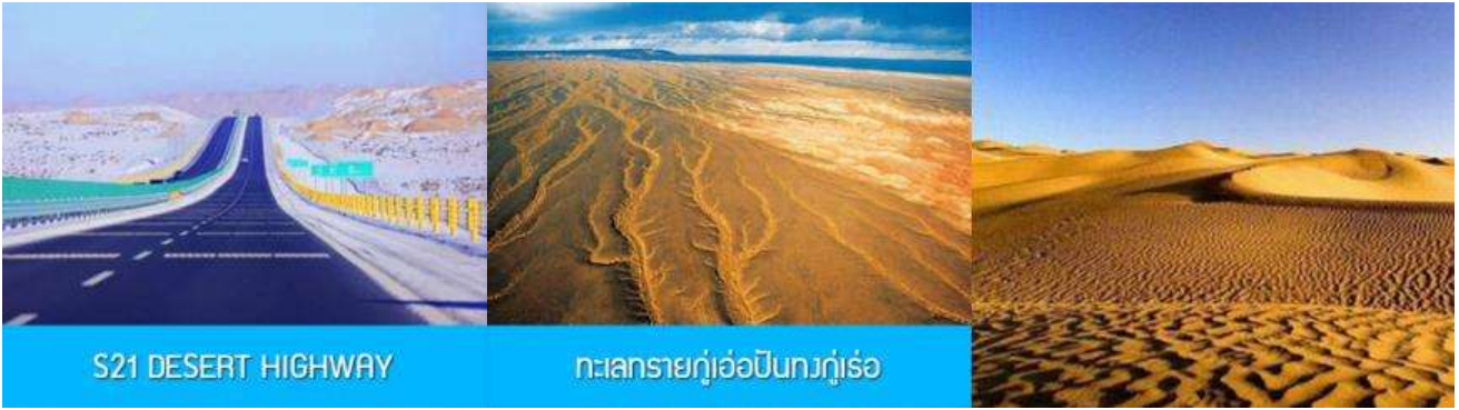
S21 DESERT HIGHWAY