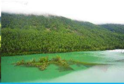
ทะเลสาบบึงกรหลับ