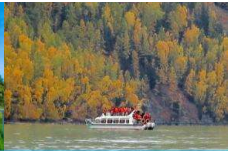
ล่องเรือชมทะเลสาบคานาสี้อ

หลังอาหารเช้าท่านสู่ จุดชมวิวคานาสี้อ 喀纳斯观景台 จุดชมวิวยอดนิยมสูงที่สามารถมองเห็นทัศนียภาพของอุทยานจากมุมสูง....ชม ศาลาชมปลา 观鱼亭 หอชมวิวยอดนิยมอยู่ทางด้านทิศตะวันตกของอุทยานฯ อยู่สูงเหนือระดับน้ำในทะเลสาบ 600 เมตร (เหนือระดับน้ำทะเล 2030 เมตร) ณ จุดนี้ท่านสามารถมองเห็นทัศนียภาพโดยรอบที่ประกอบด้วยทุ่งหญ้า ป่าไม้ ภูเขาหิมะที่ห่างไกลภายในอุทยานคานาสี้อ (การขึ้นหอชมปลาต้องปีนบันไดหลายร้อยขั้น ท่านที่ไม่สะดวกที่จะปีนบันไดสามารถชมวิวยู้อด้านล่าง)