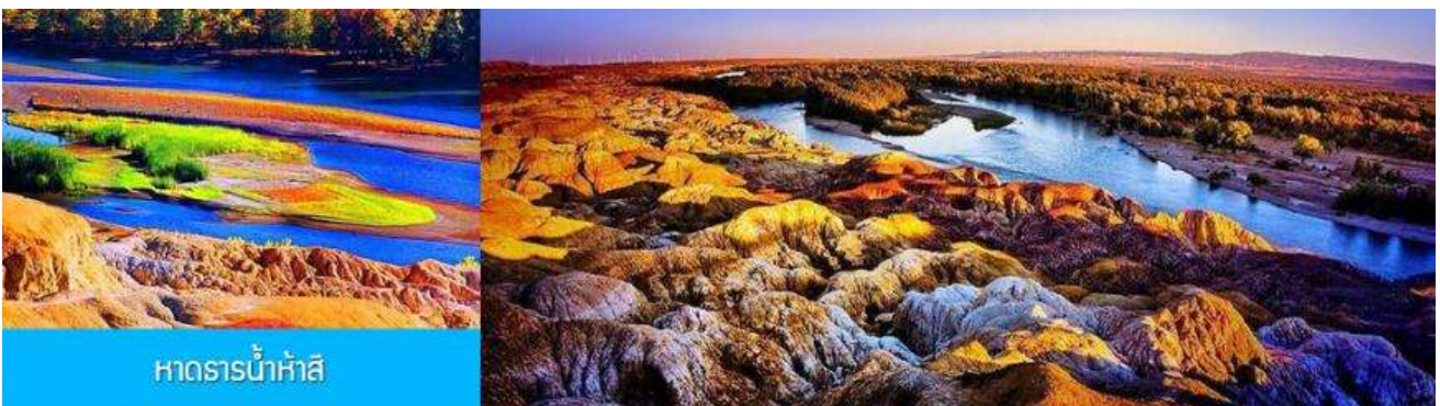
หาดธารน้ำห้าสี