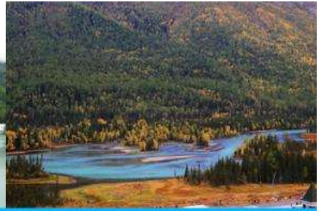
ทะเลสาบเทวดา