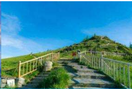
จุดชมวิวกานาสี้อ