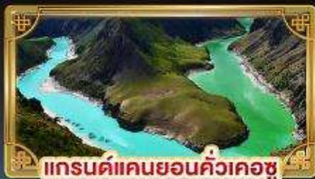
แกรนด์แคนยอนคิ้วเคอซู