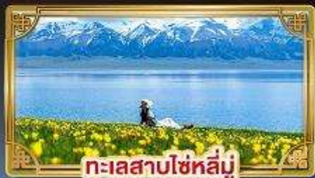
ทะเลสาบโซหลี่มู่