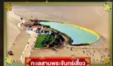
ทะเลสาบพระจันทร์เสี้ยว