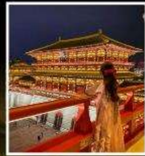
ท่าแพงอึ้งเทียนเหมิน