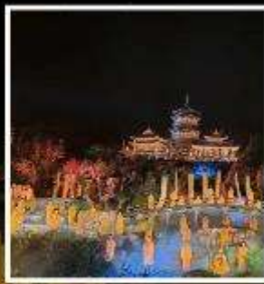
โชว์ SHAOLIN MUSIC CEREMONY