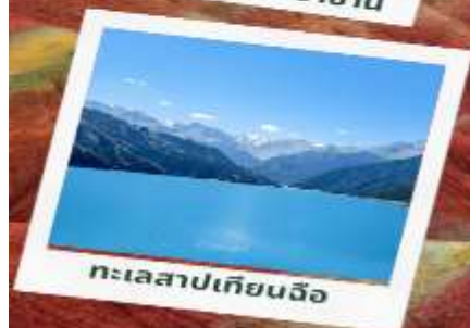
ทะเลสาบเทียนฉือ