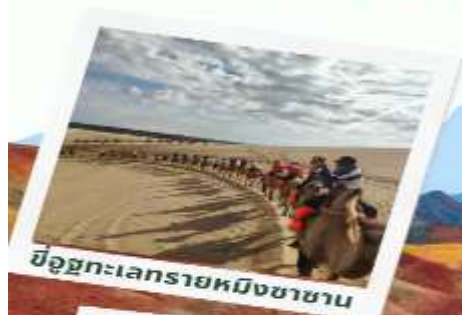
ขบวนคาราวานอูฐทรายหนิงซาฮาน