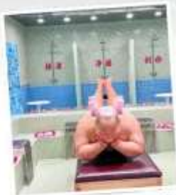
คาเฟ่ผ่อนคลายเหอผิง