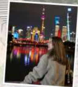
เซี่ยงไฮ้ คลาสสิก ไนท์