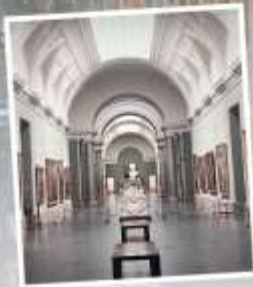
PUDONG ART MUSEUM