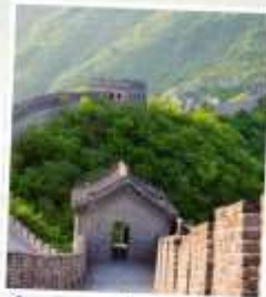
กำแพงเมืองจีนด่าน จหยงกวน