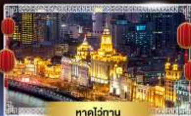
หาดวี้ถ่าน