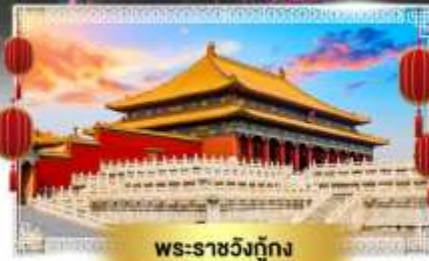
พระราชวังกู้กง