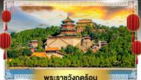
พระราชวังคุรุอัน