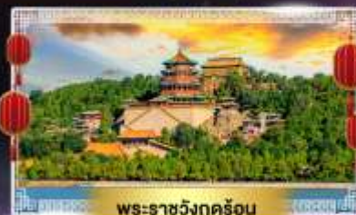
พระราชวังฤดูร้อน